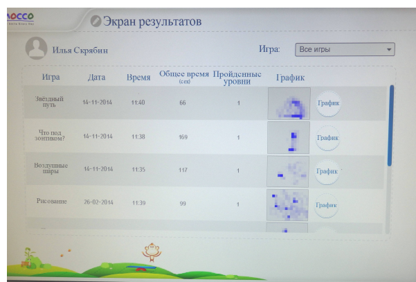
График движений позволяет судить о произвольности действий и ставит задачу контроля и целенаправленности.

Экран результатов фиксирует достижения и динамику.